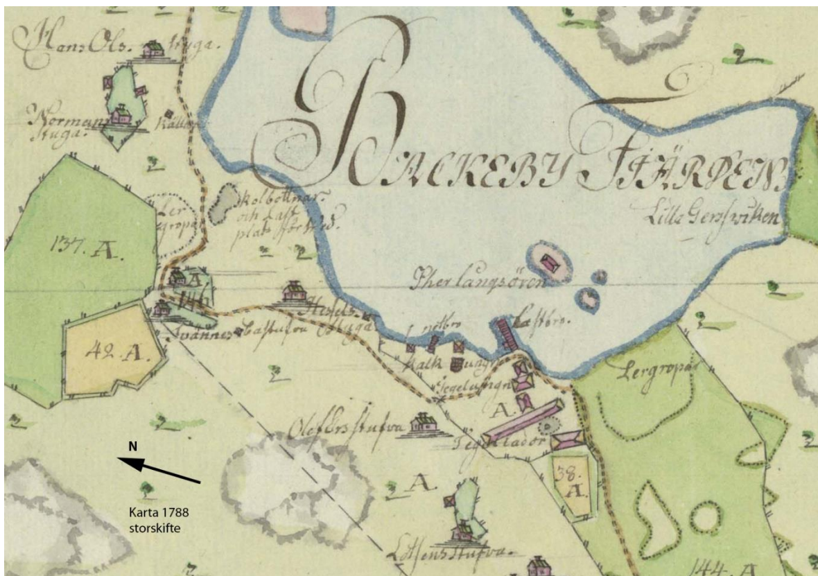
Tegelbruket med lertag vid Backbyfjärden på 1788 års karta