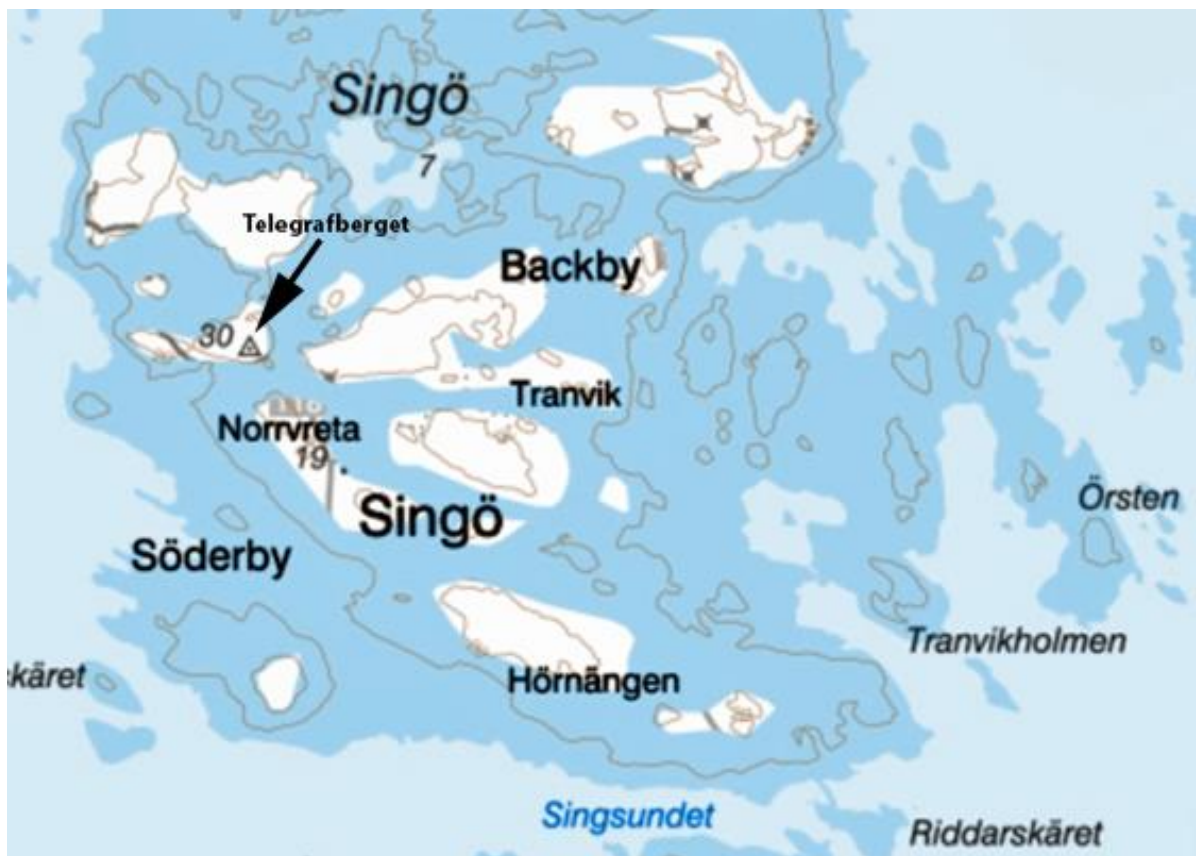
Allt som var synligt av Singö för 3100 år sedan enligt sgu.se